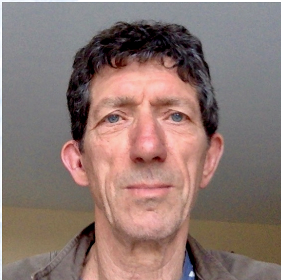
Pr. Remy Versace